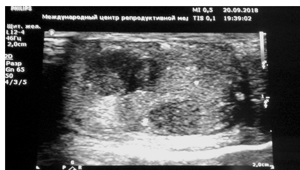
Рис. 1. Ультразвуковое исследование левого яичка у мужчины с билатеральным тестикулярным микролитиазом. Определяются множественные микролиты и неоднородность эхоструктуры, характерная для новообразований яичка

Полученные нами результаты в целом подтверждают современные представления о связи ТМ и синдрома тестикулярной дисгенезии [16] —